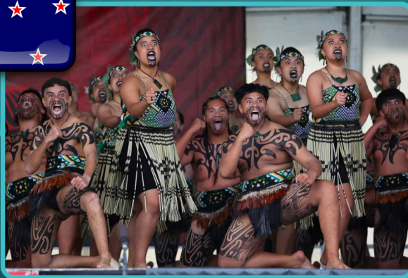
WHEIAO Cultural Group Nuova Zelanda - Auckland