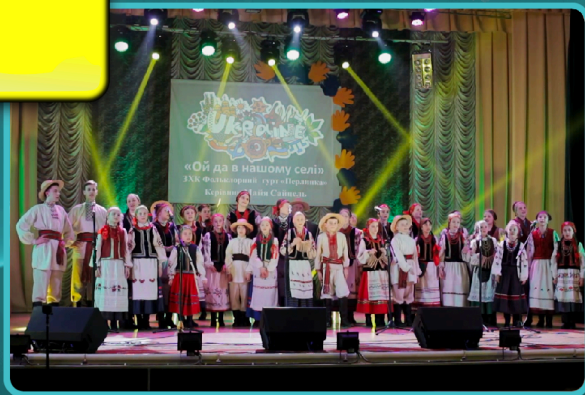
Зразковий фольклорний гурт "ПЕРЛІНКА" (PERLYNKA) Ucraina - Slavuta