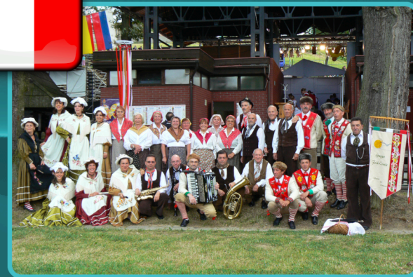
Gruppo Folk-Corale RODODENDRO Italia - Lanzo Torinese